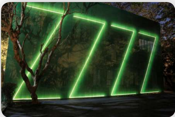
Four-Letter Film, As If—II, Flight of the Black Boxes, 24 Jorbagh, New Delhi, 2015. Installation view. Vue d'installation. Installatiezicht.