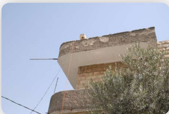
The Neighbour Before the House , Old city, Jerusalem, 2009. Working still of CCTV on roof. Photo de tournage de vidéosurveillance sur le toit. Setfoto van beveiligingscamera op een dak.

Het beeldmateriaal werd gemonteerd tot film in 2011.