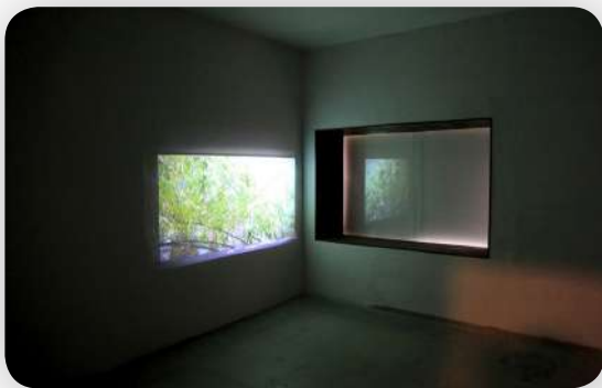
Interior Design, As If—II, Flight of the Black Boxes, 24 Jorbagh, New Delhi, 2015. Installation view. Vue d'installation. Installatiezicht.