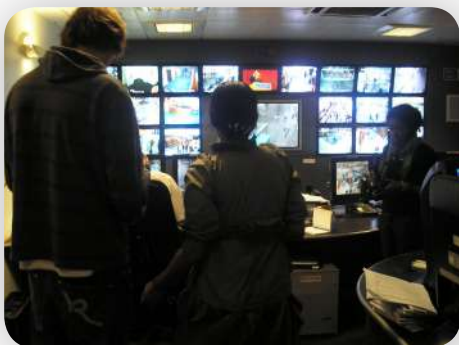
Capital Circus , Manchester, UK, 2008. LiveWire CCTV. LiveWire vidéosurveillance. LiveWire beveligingscamera.