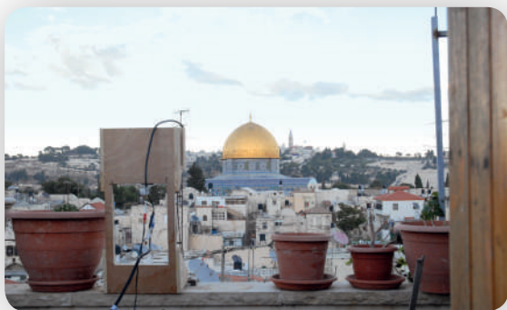
The Neighbour Before the House , Old city, Jerusalem, 2009. Working still of CCTV on roof. Photo de tournage de vidéosurveillance sur le toit. Setfoto van beveiligingscamera op een dak.