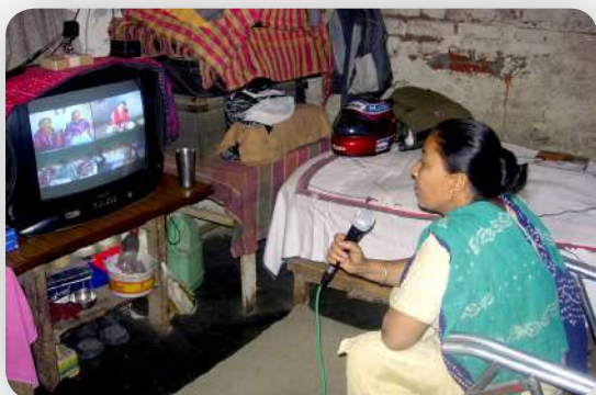
Khirkeeyan , Khirkee Extension, New Delhi, 2006. Working still, Episode 2. Photo de tournage, Épisode 2. Sefoto, Episode 2.

KHIRKEEYAN 2006 7 EPISODES, 5 ON SHOW SHAINA ANAND WITH AASHTA CHAUHAN, GUARAV CHANDELYA, RUNTIME VARIES AND OTHERS